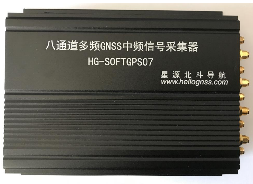
图 1 HG-SOFTGPS07 采集器

HG-SOFTGPS07 是北京星源北斗导航技术有限公司基于最新的美信 MAX2771 射频芯片设计的采集器,通道数首次达到了 8 通道,基于 USB3.0 和 DDR3 技术做数据传输。