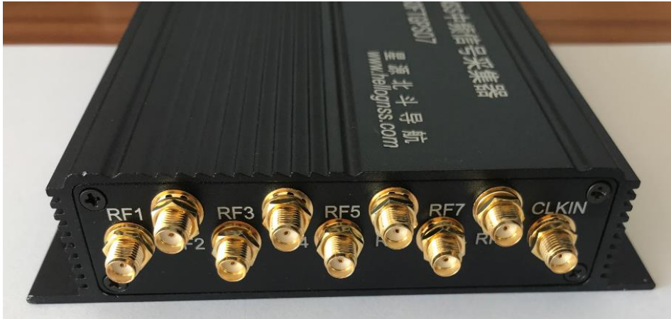
图 3 HG-SOFTGPS07 采集器后面板

MAX2771 是下一代卫星导航信号接收芯片，覆盖 E5/L5, L2, E6, E1/L1 以及 GPS, GLONASS, Galileo, QZSS, IRNSS 和中国北斗三代系统。