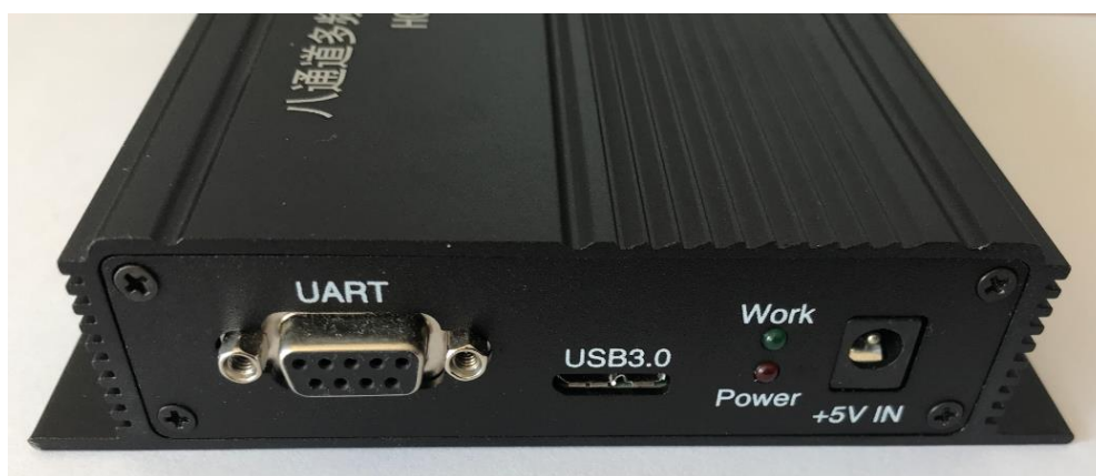
图 2 HG-SOFTGPS07 采集器前面板